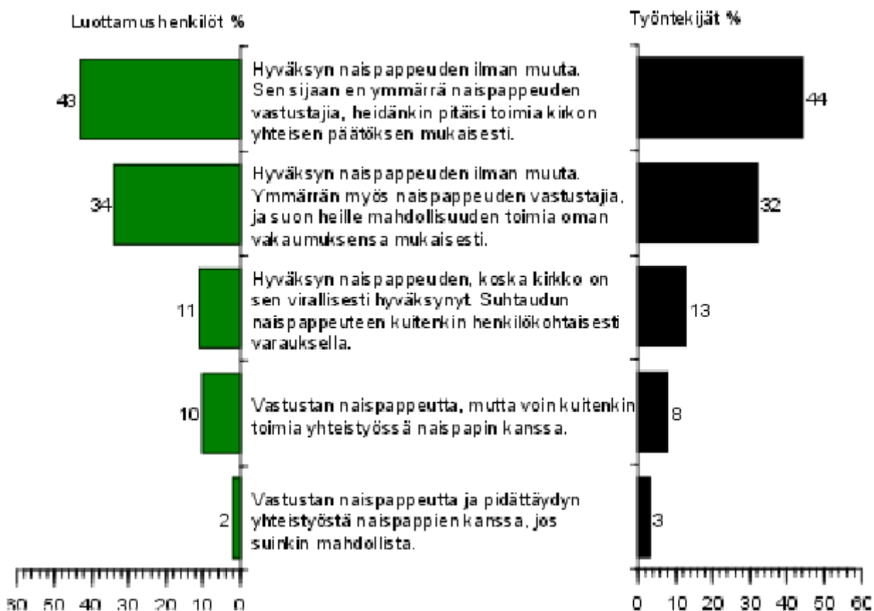
Kuvio 2. Seurakunnan työntekijöiden ja luottamushenkilöiden suhtautuminen naispappeuteen. Seurakuntien vaikuttajakysely 2/99, N=1370.

Eri ikäisten seurakunnan työntekijöiden ja luottamushenkilöiden suhtautumisessa naispappeuteen ei ollut suuria eroja. Alle 40-vuotiaat seurakuntien työntekijät ja luottamushenkilöt kuitenkin vastustivat naispappeutta hieman useammin kuin vanhemmat vastaajat. Samoin miehet vastustivat naispappeutta useammin kuin naiset.